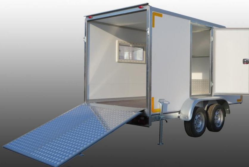
Прицеп-фургон предназначен для перевозки мототехники и отдыха.